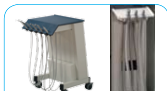
Verrijdbare behandelunit € 10.300,- Verrijdbare afzuigunit € 2.600,-