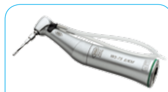
W&H Hoekstuk, R.V.S. € 830,-