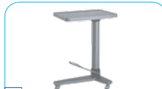
OK kwaliteit hydraul. overzettafel € 1398,-