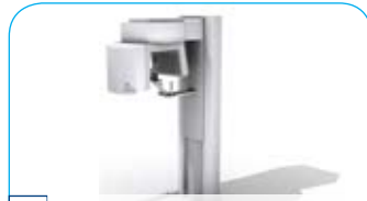
NewTom 3D CT scanner