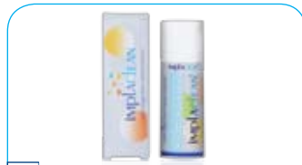
Implaclean tandpasta € 8,36