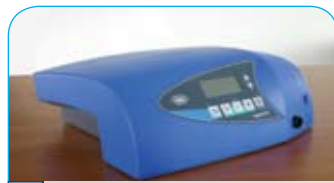
W&H boorunit € 2455,-