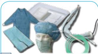
Disposet en Disposet Plus vanaf € 16,95