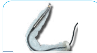
Boorhoezen € 30,45 per d. van 12 s.