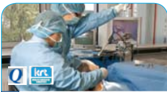
Opleiding tot implantoloog € 2.995,-