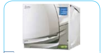
W&H Lisa sterilisator € 6.090,-